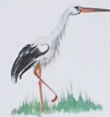
L'oiseau : Rosane Suhas