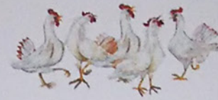
Petite chorale Blues Café